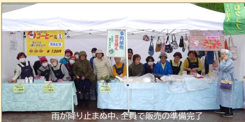
雨が降り止まぬ中、全員で販売の準備完了

このような中で、主催者側から午前中で販売を中止し撤収も可との連絡が入り、私達もやむなく販売を打ち切り撤収することとしました。皆さんから提供された手作り作品は事務所で保管し次の機会に活用させて戴きます。実行委員の皆さんご苦労様でした。