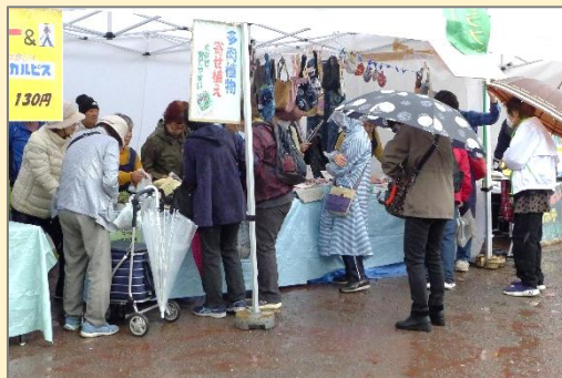
雨にもめげず買いに来られたナルクファン