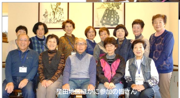
星田地区ほかに参加の皆さん