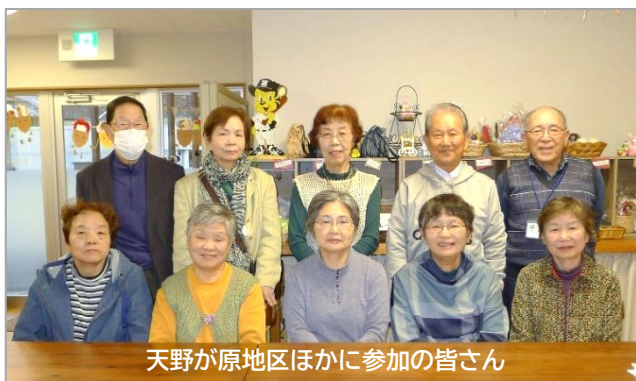
天野が原地区ほかに参加の皆さん