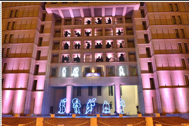
クリスマス・大阪市役所正面 木下雅晴作